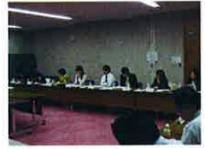
<写真：第1回ナイトセミナー>

消費者庁の「健康食品の表示に関する検討会」が終わり、8月中に最終報告書がまとめられる予定です。9月のナイトセミナーではその最終報告書の内容について参加者とディスカッションをしながら見ていきます。